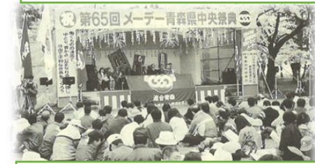
第65回メーデー【集会の様子】