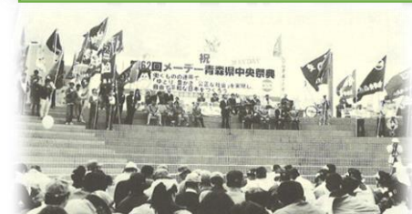
第62回メーデー【集会の様子】