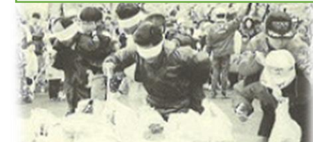
第65回メーデー【アトラクションの様子】

懐かしい写真広場 『過去のメーデー写真』 東青地協は、一九八九年十二月二十六日に結成大会を開催し、二〇一九年に結成三〇周年を迎えます。このコーナーでは、結成大会やこれまでも行っている運動会等の懐かしいスナップ写真を紹介していきます。 ■今回は、「過去のメーデー」の写真となります。上段の写真は、連合青森が結成されて初の記念すべき第六一回メーデーの写真です。青森市の平和公園で開催し、新町通りをデモ行進していた模様です。次の写真は、第六二回メーデーの写真で、青い森公園で開催し、第六四回まで同会場にて開催されており、第六五回メーデーから、合浦公園でメーデーが開催されております。