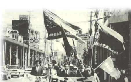
第61回メーデー【デモ行進の様子】