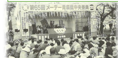
第65回メーデー【集会の様子】