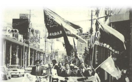
第61回メーデー【デモ行進の様子】