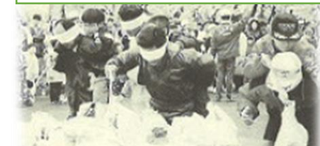
第65回メーデー【アトラクションの様子】

懐かしい写真広場 『過去のメーデー写真』 東青地協は、一九八九年十二月二十六日に結成大会を開催し、二〇一九年に結成三〇周年を迎えます。このコーナーでは、結成大会やこれまでも行っている運動会等の懐かしいスナップ写真を紹介していきます。 ■今回は、「過去のメーデー」の写真となります。上段の写真は、連合青森が結成されて初の記念すべき第六一回メーデーの写真です。青森市の平和公園で開催し、新町通りをデモ行進していた模様です。次の写真は、第六二回メーデーの写真で、青い森公園で開催し、第六四回まで同会場にて開催されており、第六五回メーデーから、合浦公園でメーデーが開催されております。