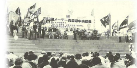
第62回メーデー【集会の様子】