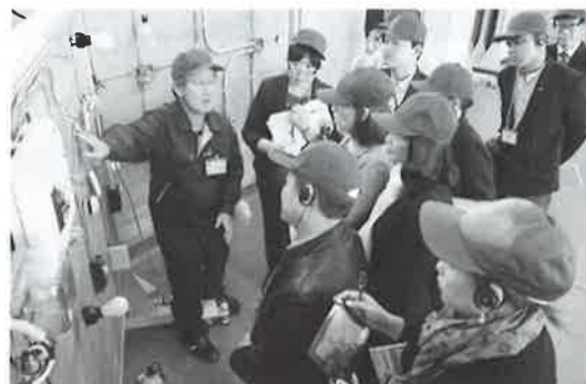
ポリテクセンターにて職業訓練場を見学