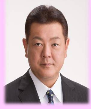
青森県議会議員 木明 和人 (無所属)