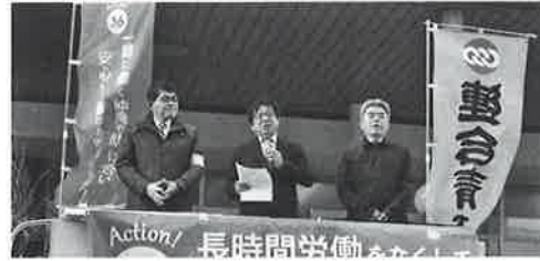
4月連合の日。 掛村副会長も参加し、36協定を周知

4月と5月の取り組みは、4月から施行された改正労働基準法について、時間外労働の上限規制や、年5日の有給休暇の取得義務化など罰則付きの法整備がされたことを周知する街宣行動となった。