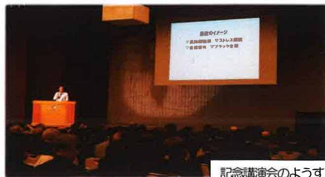
記念講演会のようす